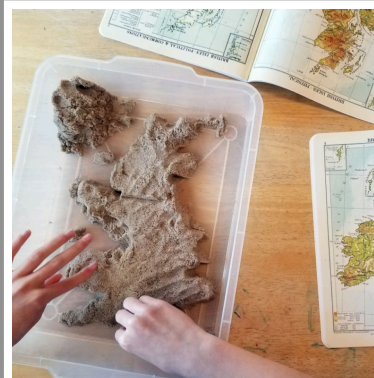
Exemple visuel du travail de modelage. Source de l'image

L'enfant passe le reste de la leçon à modeler l'Europe en observant bien la carte et en essayant de la reproduire au mieux.